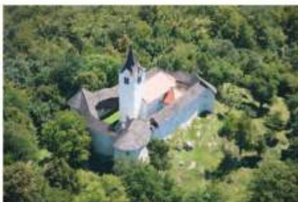
Tabor nad Cerovim

Naš izlet smo nadaljevali po označeni učni poti po gozdu, mimo izvira Podlomščice, Županove (Taborske) jame, do Tabora nad Cerovim, ki je eden izmed manjših, vendar najlepše ohranjenih protiturških taborov na Slovenskem. Obisk Županove jame, v katero vodi 478 stopnic, pa smo prihranili za kdaj drugič.