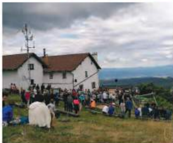
Državna proslava na Kumu ob 30-letnici napada na Kum, 2.7.2021