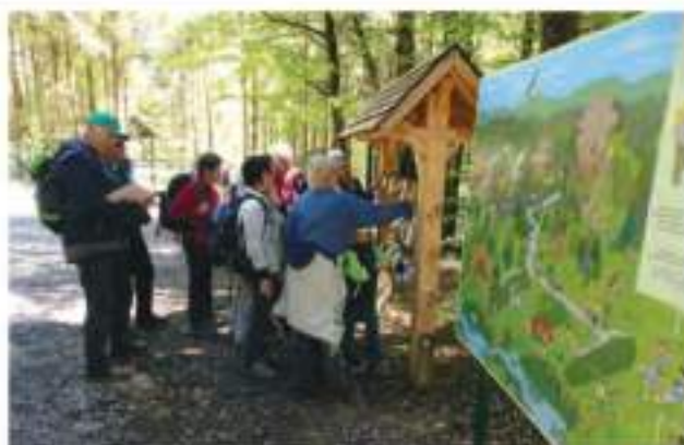
Na učni poti Po sledeh vodamca