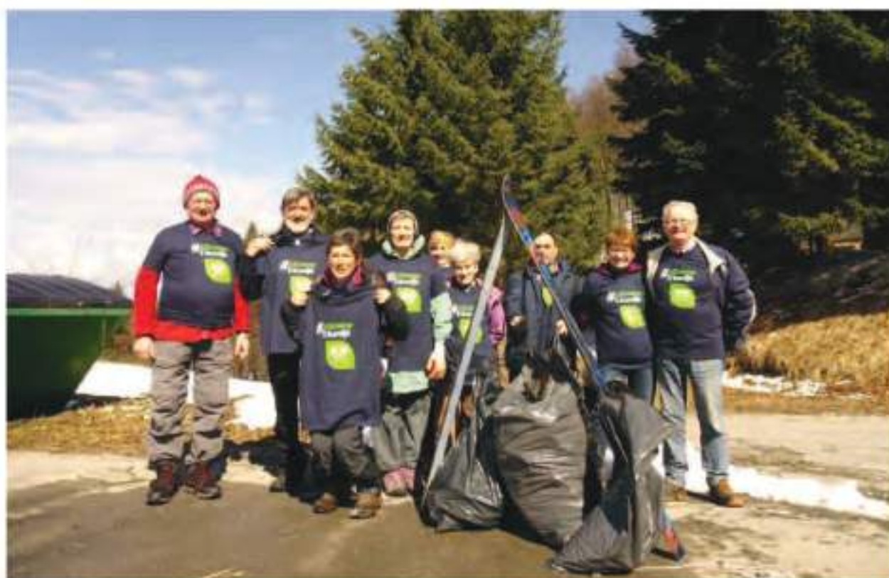
Akcija »Očistimo Trbovlje«

V letu 2021 smo aktivnosti dogovarjali na sedmih sejah UO, od tega smo dve seji izpeljali na daljavo, sprejeli smo 17 sklepov, številne zaključke in sprotne aktivnosti pa smo dogovarjali na naših četrtkovih srečanjih oziroma telefonsko. Aktivno smo delovali na nivoju MDO in na področnih odborih posameznih komisij PZS. Za udeležbo na skupščini PZS v Velenju pa smo pooblastili predsednika MDO-ja. Dneva slovenskih planincev v minulem letu ni bilo mogoče izvesti v klasični obliki z druženjem na skupnem prireditvenem mestu, zato smo dogodek obeležili na lokalnem nivoju.