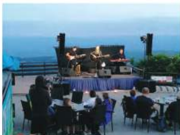
Poletje pod zvezdami, Kum, julij 2021