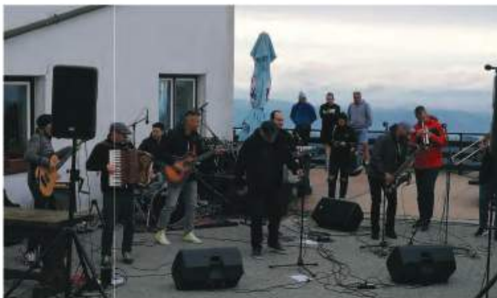
Orleki na Kumu